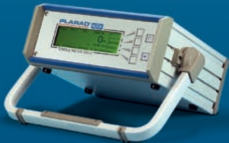
Измерительное оборудование для гайковертов с моментной затяжкой