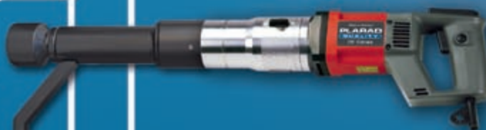
Различные удлинения и адаптеры для труднодоступных мест.