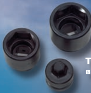
Торцевые специальные вставки и головки